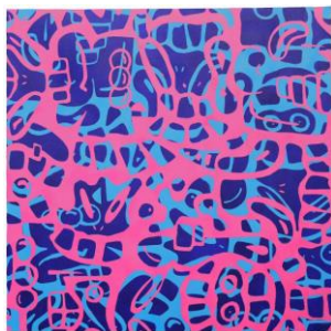
Mattia Fusi "Groviglio emotivo"