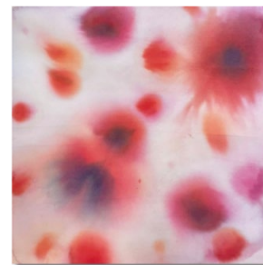
Camilla Trumellini Dalia 2024 Ecoline colori per tessuto su tela 90 x 90 cm