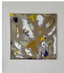
Noa Luna "Songbird, Dance!" 2024 Tecnica mista su tela 80 x 80 cm