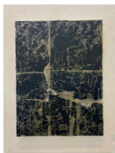
Giulia Senn Segno - ri-veta-zione 2024 Colore ad olio e velina su tela 80 x 60 cm